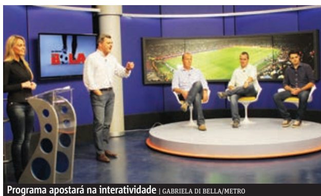
Programa apostará na interatividade

A partir das 13h de hoje a tela da Band apresentará “Os Donos da Bola”, novo programa esportivo da emissora que irá ao ar de segunda à sexta-feira e terá uma hora de duração. Além de diversos quadros e de debates acalorados acerca dos desempenhos da Dupla Gre-Nal, a atração apostará fortemente na interatividade com o telespectador por meio das redes sociais.